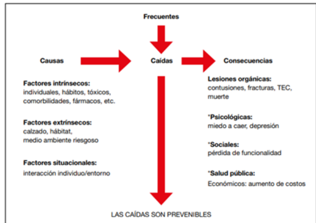
Imagen 3. Diagrama de caídas, factores causales y consecuencias.