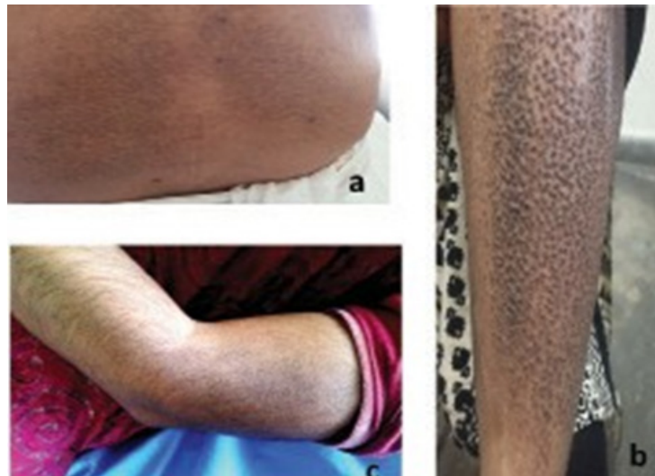
Figura 1. Presentación clínica de la amiloidosis cutánea.