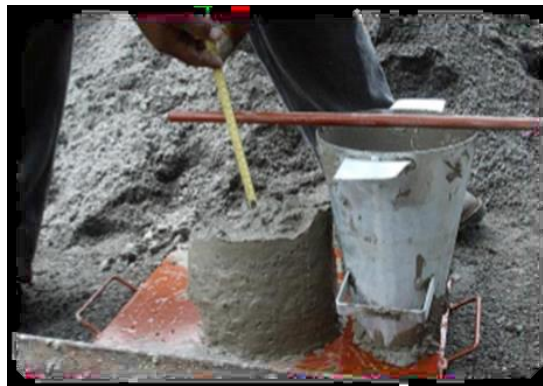
Figura N° 18.- Cono de abrams