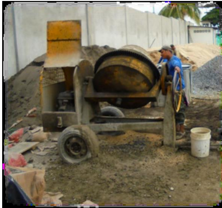
Figura N° 10.- Mezcla del hormigón