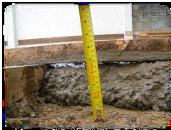
Figura N° 11.- Replanteo

Este elemento debe utilizarse de 25 a 30 minutos máximo después de su mezcla, antes de su fraguado inicial. El concreto debe ser aplicado de manera correcta evitando que sus agregados se segreguen, esto quiere decir que se separen los agregados finos de los gruesos, lo ideal sería que el concreto trabaje de manera uniforme. Esta mezcla es transportada por medio de carretillas, que tomara un tiempo de 2 minutos de cargada del hormigón a la carretilla y 2 minutos de vaciado del hormigón al terreno. El terreno donde se vaciara el hormigón debe mantenerse humedecido para que sea de ayuda al momento del fraguado, esto evitara un poco la perdiga de líquido.