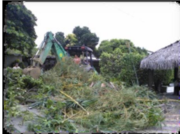
Figura N° 1.- Corte de terreno usando maquinaria