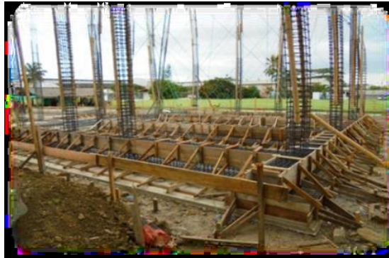
Figura N° 16.- Encofrado

Para realizar el hormigón se usara concretera de un saco, para la cual se tomaran las medidas en parihuela o cajo netas. Dosificación en parihuelas para la preparación de hormigón en 1 m 3 .