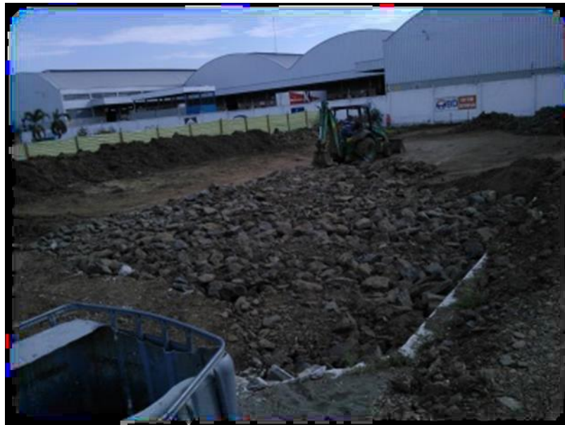
Figura N° 6.- Mejoramiento del terreno con piedra base

Rellenar una primera capa de piedraplen –GW- de 0.40m, para mejorar el terreno, compactada al 100%, se deberá utilizar rodillo liso vibratorio de 18 Ton. La capa en contacto con la cimentación será de espesor 0.90m, constituida por material de sub-base clase 3. Esta será de plataforma de contacto suelo-estructura. Considerará que el sub suelo desarrolla una capacidad de carga máxima de 16.6Tno/m 2 , se ha considerado factor de seguridad tres.