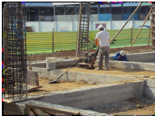
Figura N° 9.- Compactación del terreno

Para realizar este trabajo se requiere del uso de carretillas las cuales van a ser manipuladas por los oficiales, por medio de ellas se podrá trasladar el material importado – cascajo mediano- el cual va ser depositado en los orificios que se originan en las intersecciones de las zapatas, hasta obtener una capa homogénea no máximo a los 0.20m como lo indican las especificaciones, a su vez se tomara en cuenta si el material se encuentra seco o húmedo ya que este debe cumplir con una humedad óptima, luego de que se cumpla lo dicho se procederá a la compactación, la cual se realiza con maquinaria liviana hasta verificar que el suelo se encuentre bien compactado y consolidado. De esta manera se realiza el relleno manual hasta llegar al nivel requerido, realizando todos los pasos por cada capa. Este relleno deberá ser debidamente colocado, tomando en cuenta las especificaciones ya planteadas.