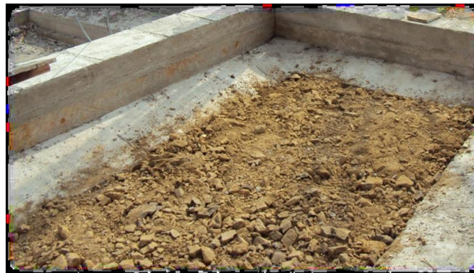
Figura N° 8.- Relleno Manual

Estos volúmenes varían según las dimensiones de los ejes, este relleno se realiza manualmente ya que la maquinaria no puede entrar a estas áreas reducidas.