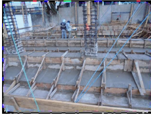
Figura N° 17.- Hormigonado