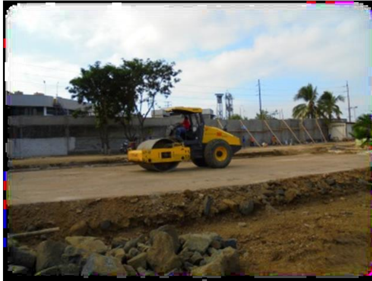
Figura N° 7.- Compactación del terreno con rodillo lizo