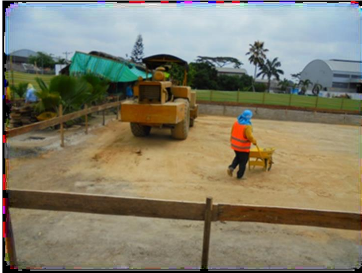
Figura N° 4.- Realización de trazados y replanteo