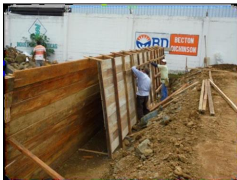
Figura N° 19.- Encofrado de Muros

Para iniciar el hormigonado se debe realizar el encofrado de los muros, utilizando tablas, cuartones y clavos. Las tablas se colocarán a lo largo del muro uniendo las tablas a lo alto de la dimensión del muro, por medio de cuartones y el uso de clavos. Estos cuartones se anclaran al suelo para que sirvan de estabilidad para el encofrado. En la parte superior del tablero se colocaran tiras de madera que van a estar clavadas a los tableros, las cuales van a evitar que los tableros se junten entre sí.