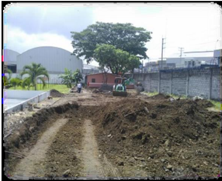
Figura N° 5.- Excavación en el terreno