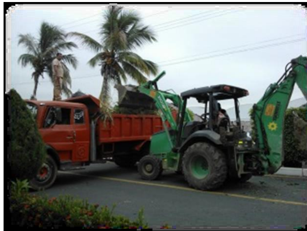
Figura N° 2.- Desalojo de Material