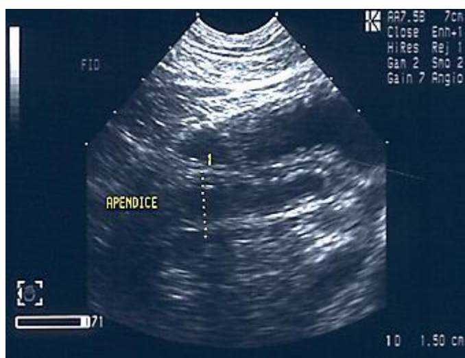
Figura N° 2.- APENDICITIS AGUDA EN ECOGRAFÍA

La detección de una estructura tubular con extremo cerrado en el borde inferior del ciego, que esté llena de líquido, que no sea compresible y que mida más de 6 mm de diámetro, hace el diagnóstico ecográfico de apendicitis. Es posible detectar también un coprolito, líquido periapendicular y masa inflamatoria, en los casos complicados. Estudios de metanálisis reportan una sensibilidad del 85% con especificidad del 92% para el ecosonograma en el diagnóstico de apendicitis y un índice de exactitud global del 93%.