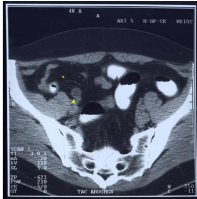
Figura N° 3.- APENDICITIS AGUDA POR TOMOGRAFÍA

en el aspecto del ciego, cambios inflamatorios en el cuadrante inferior derecho (infiltración de la grasa periapendicular, flemón, gas extraluminal, colecciones, adenopatías), engrosamiento focal de la pared del íleon distal y engrosamiento focal de la pared del sigmoides. Los estudios asignan a este método una sensibilidad del 96% al 98% y hasta un 89% de especificidad.