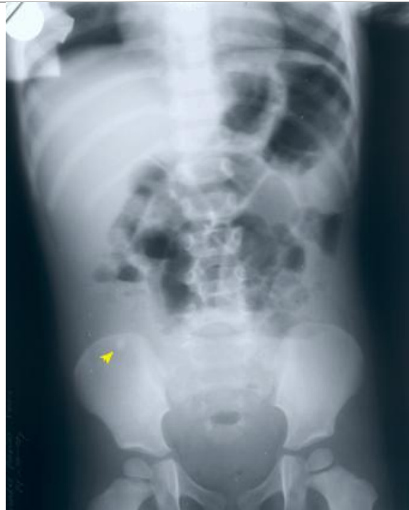
Figura N° 1.- APENDICOLITO