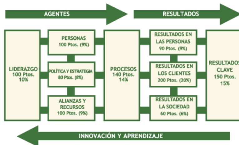
Figura N° 3. Modelo EFQM

Fuente: (González, Maldonado, & Nava, 2010)