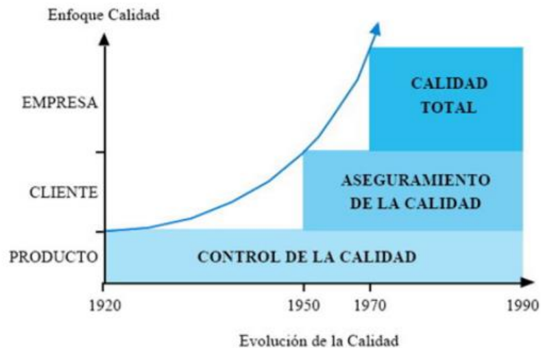
Figura N° 1. Evolución de la calidad.