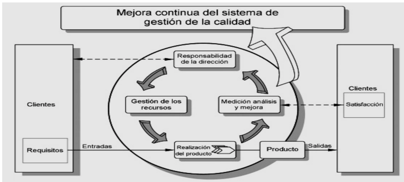
Imagen 1. Procesos que involucra la mejora continua del sistema de gestión de Calidad