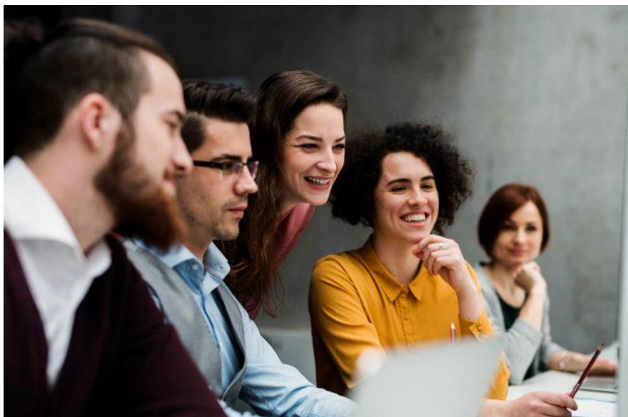
Imagen 1. Programa de empresa Saludable

Las organizaciones saludables llevan implícitos dos conceptos: organización y salud. Por una parte, la organización hace referencia a las formas en que se estructuran y gestionan los procesos de trabajo, incluyendo el diseño de los puestos, los horarios de trabajo, el estilo de dirección, la efectividad organizacional y las estrategias organizacionales para la adaptación de los empleados, esto se traduce en las prácticas de desarrollo de los recursos humanos. Por ende, la adición del término saludable deriva de la idea de que es posible distinguir sistemas de organizaciones sanos y enfermos. Es decir, distinguir, en definitiva, formas de estructurar y gestionar los procesos de trabajo con resultados más saludables que otros.