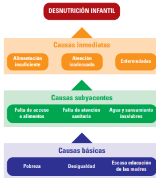
Figura N°1 Causas de desnutrición

La nutrición es un derecho fundamental para todo niño establecido en la Carta Magna de todo país, no obstante, la realidad es otra, existe un porcentaje importante a nivel mundial de niños que no cuentan con una ingesta calórica adecuada a su edad, dificultando su desarrollo físico e intelectual o incluso causando la muerte del niño. La UNICEF propone entre las causas de la mal nutrición el siguiente esquema: